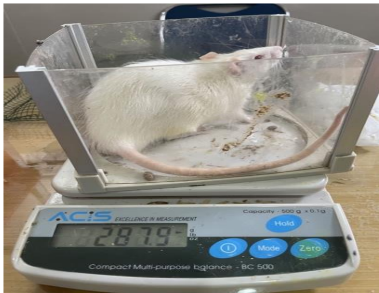
Gambar 1. Penimbangan berat badan hewan coba

Pengukuran berat badan dilakukan setiap minggu dan dilakukan penimbangan dengan timbangan hewan.